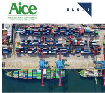
Nota informativa per le aziende associate AICE Crisi del Mar Rosso e commercio con l'estero: capire e gestire la situazione attuale e futura

gli investimenti esteri qualificati nel territorio italiano e rafforzare l'attrattività del sistema Paese sui mercati internazionali.